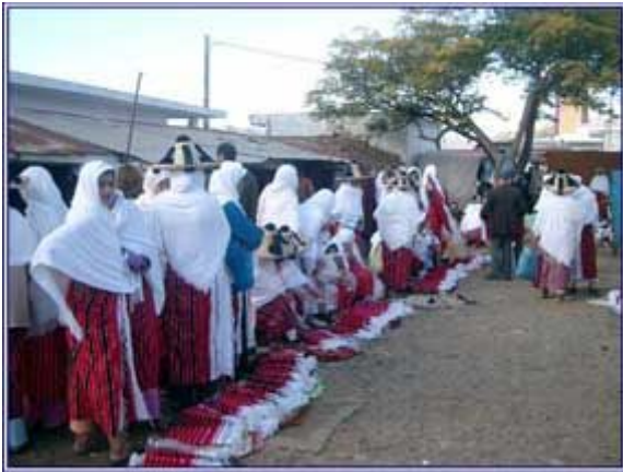
Venta de tejidos y ropas tradicionales, realizadas artesanalmente en el mercado de Souk El Arba.