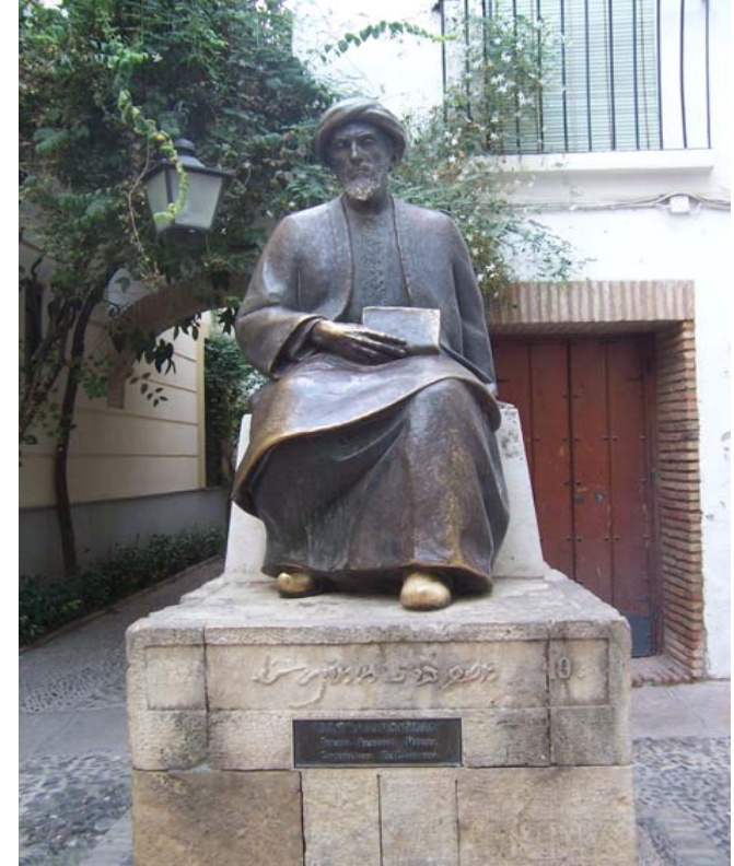
Monumento a Maimónides en Córdoba

اليوم التعليمي الأول للإسبانية بجامعة سيدي محمد بن عبد الله بفاس